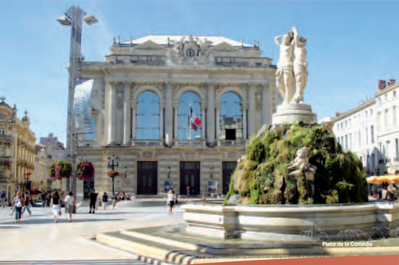
Place de la Comédie