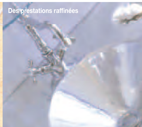
Des prestations raffinées