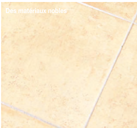
Des matériaux nobles