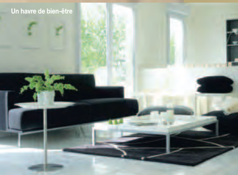
Un havre de bien-être