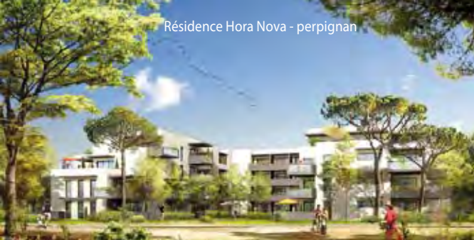
Résidence Hora Nova - perpignan