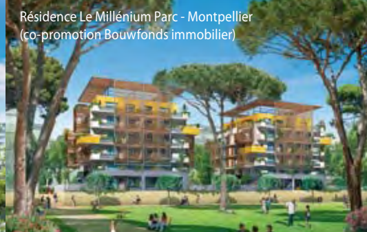
Résidence Le Millénium Parc - Montpellier (co-promotion Bouwfonds immobilier)