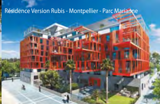
Résidence Version Rubis - Montpellier - Parc Marianne