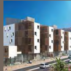
Résidence Via Nostra - Sète