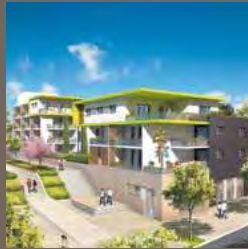
Résidence Olympe - Montpellier Ovalie