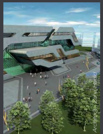
Architecte - Zaha Hadid