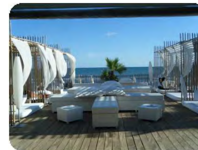
Les plages de Palavas les Flots