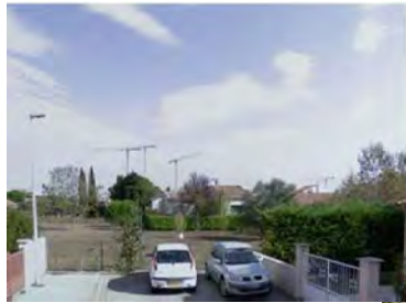
Vue 1 : impasse de l'étang