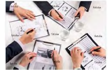
Présentation du Programme