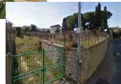
Vue 4 : Avenue du Pont Trinquat