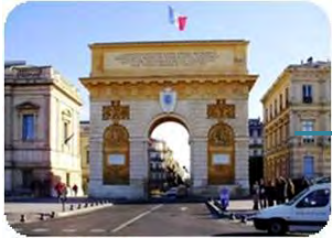
Centre ville de Montpellier