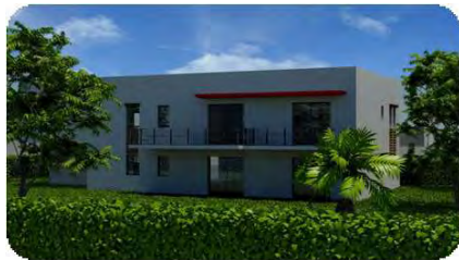
Les Vignes de L'Ecluse