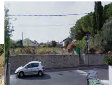
Vue 2 : Avenue du Pont Trinquat