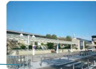
Aéroport international de Montpellier