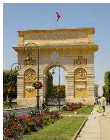
Arc de Triomphe