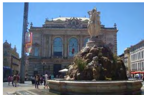
Place de la Comédie