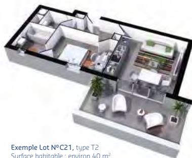
Exemple Lot N°C21, type T2 Surface habitable : environ 40 m 2 Balcon : environ 13 m 2

La qualité de vie s'y traduit également par des façades aux lignes contemporaines mêlant des volumes blancs aux habillages en bois de teinte naturelle, dans une homogénéité architecturale qui confère à la résidence la parfaite maîtrise des espaces et de la lumière.