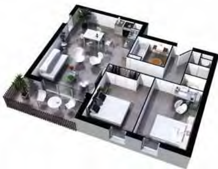
Exemple Lot N°A13, type T3 Surface habitable : environ 65 m 2 Balcon : environ 6 m 2