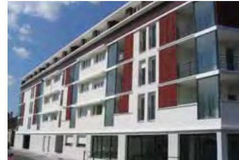
Le Rouzic - Bordeaux