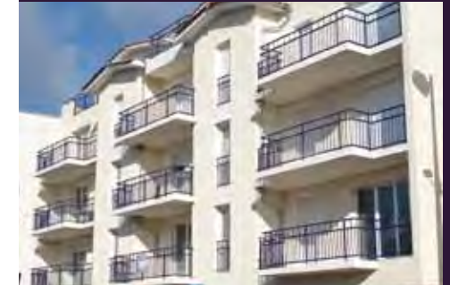
Villa Aquarelle - Andernos