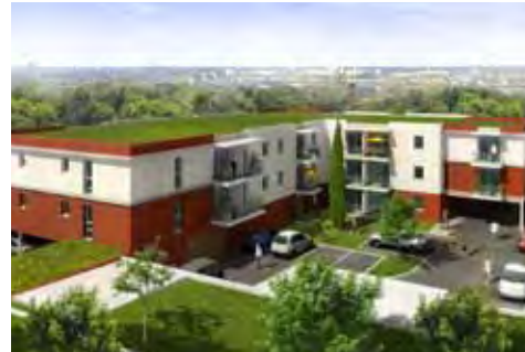
Les Hauts du Cypresat - Cénon

Notre objectif : mettre toujours tout en œuvre pour que vous soyez bien chez vous, dans votre vie, dans votre ville, mais aussi, vous offrir un patrimoine immobilier judicieux, un investissement pérenne.