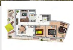
Exemple de 3 pièces (n°213) - 65 m 2 de surface habitable et 18 m 2 de balcon