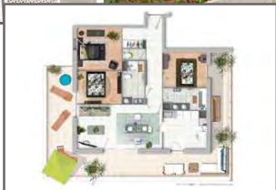
Exemple de 4 pièces (n°321) - 85,45 m 2 de surface habitable et 48 m 2 de terrasse