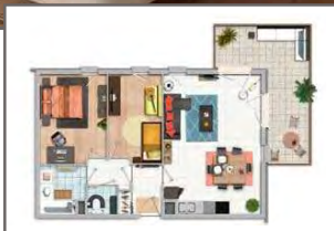
Exemple de 3 pièces (n°213) - 65 m 2 de surface habitable et 18 m 2 de balcon