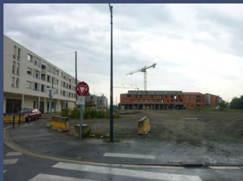
Place de la ZAC et résidence à droite