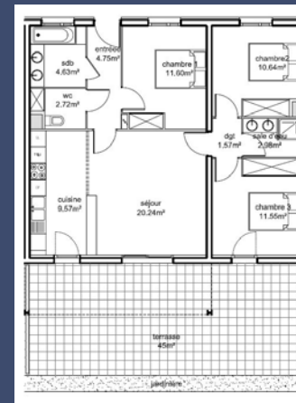
Exemple de T4 - RDC