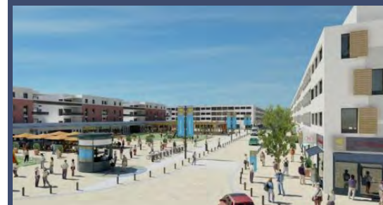
Future place Centrale de la ZAC