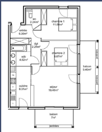
Exemple de T3 - 2eme etage