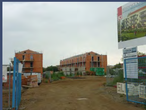
Vue des deux bâtiments depuis l'entrée