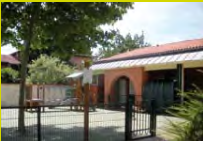
Groupe scolaire à Saint-Simon