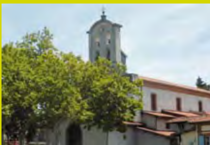
Église de Saint-Simon