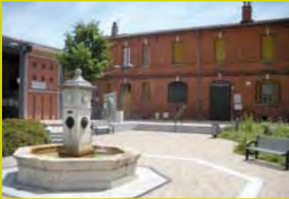
Mairie annexe de Lafourquette

Moderne et chaleureuse, Toulouse est aujourd'hui une des villes les plus prisées de France, accueillant chaque année plus de 6100 nouveaux habitants (5) . Exemple de dynamisme économique et leader dans les secteurs de l'aéronautique, du spatial et de l'électronique embarquée, elle se démarque également grâce aux projets de grande envergure qu'elle propose (Cancéropole, Aerospace Valley). Douceur de vivre légendaire, patrimoine culturel d'exception, charme et convivialité, Toulouse offre le meilleur d'elle-même à ses résidents, pour un quotidien placé sous le signe du bien-être.