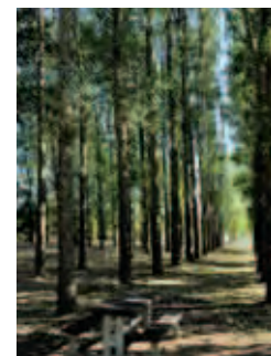
Base verte des Argoulets