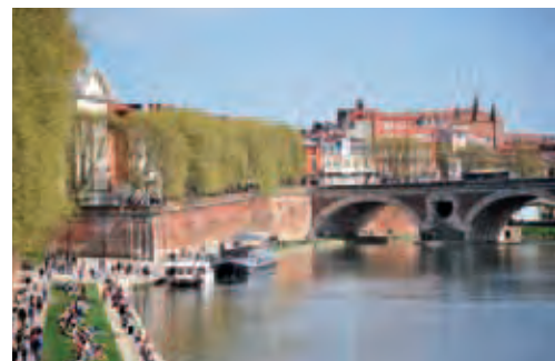
Les quais de la Daurade

À travers les nuances flamboyantes de sa brique rose et son accent chantant, c'est toute la chaleur et la convivialité du sud-ouest qui s'invitent chez vous !