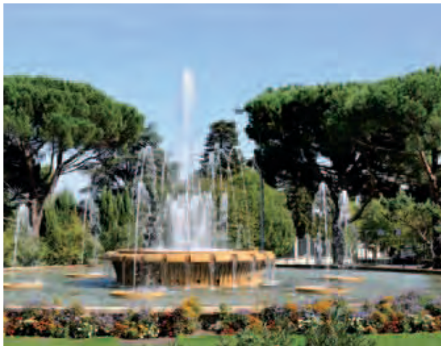
Quartier La Roseraie

Quartier haut en couleurs, la Roseraie répond aux exigences d'une vie dynamique et contemporaine. Infrastructures publiques, scolaires ou encore sportives : la résidence Les Embellies réussit la synthèse parfaite entre cadre de vie préservé et praticité au quotidien.