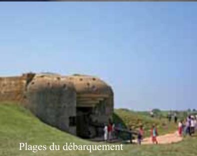
Plages du débarquement