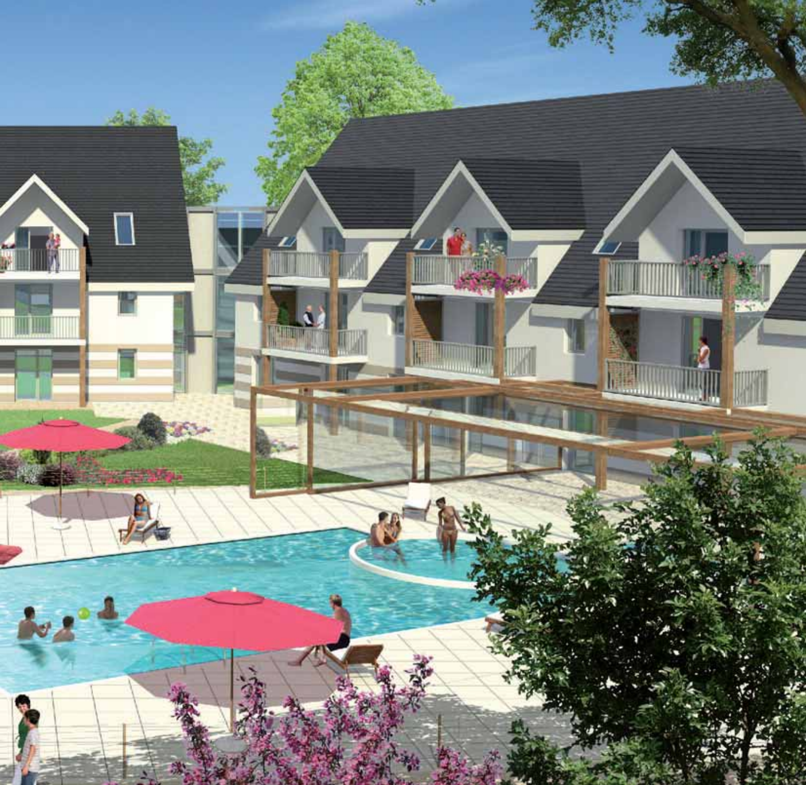
Vue du terrain