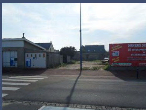
Entrée de la résidence