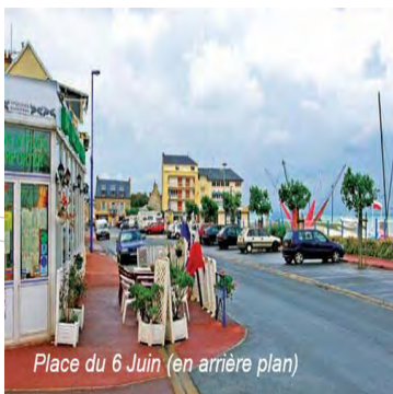
Place du 6 Juin (en arrière plan)