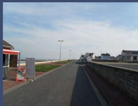
Digue de la mer devant la résidence