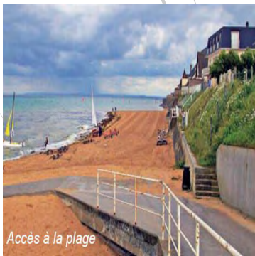
Accès à la plage