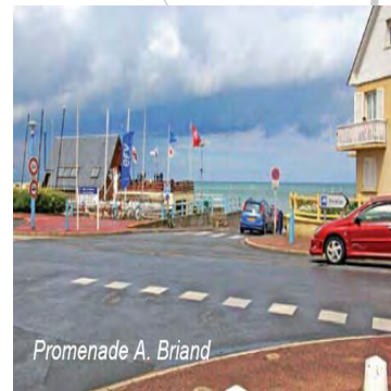
Promenade A. Briand