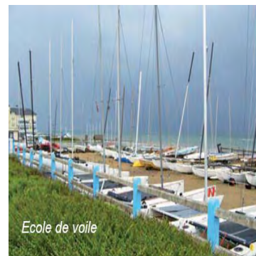
Ecole de voile

Station balnéaire familiale depuis 1921, Langrune-sur-mer est aujourd'hui propice aux loisirs de la plage, aux activités nautique et à la pratique de la pêche à pied. La petite ville offre tous les commerces et services de proximité (médecin, boulangerie, artisans...) et profite du dynamisme de la ville de Caen.