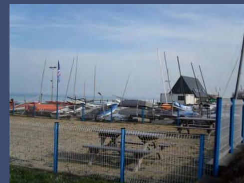
Ecole de voile proche résidence