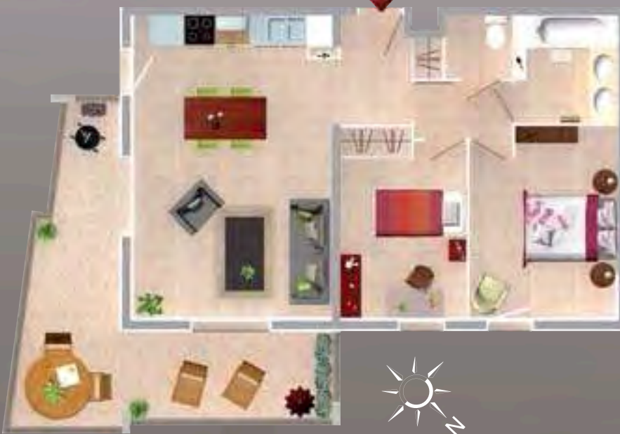
T3 de 59,60 m 2 avec terrasse de 19,25 m 2 (Lot B 403)

Privilégiant la lumière et l'espace, avec de généreuses ouvertures sur l'extérieur (terrasses), Villa Camoins offre de belles pièces de jour pour des moments d'intimité ou des moments détente à partager dans le patio intérieur.