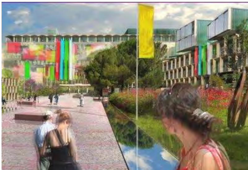
Le centre de lettres et sciences humaines d'Aix-Schuman après rénovation

Les 12 futurs campus d'excellence, dont Aix-Marseille, ont été dévoilés hier