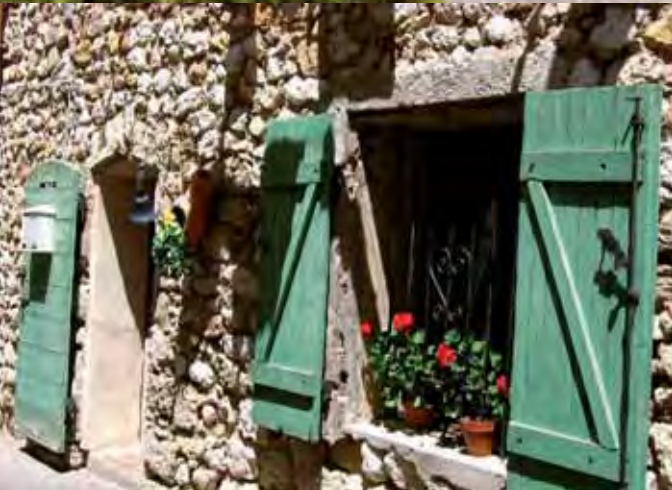
Bouc Bel Air