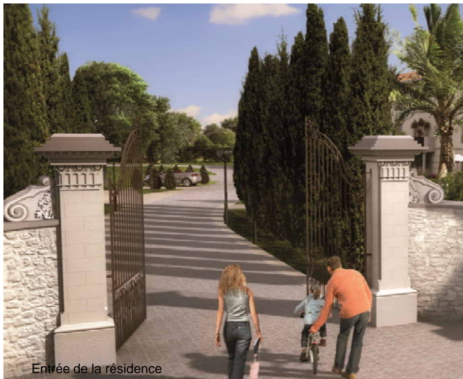
Entrée de la résidence

La Résidence Villa de Provence est une résidence 4 étoiles (1). La résidence est un complexe qui s'intègre parfaitement à son environnement. Les prestations ont été soignées : salle de fitness - sauna, piscine extérieure, réception / espace restauration automatique, bar / salle petit-déjeuner et laverie automatique.