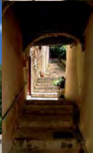
Ruelle Bouc Bel Air