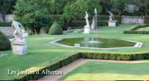
Les jardins d'Albertas