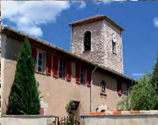
Église Bouc Bel Air