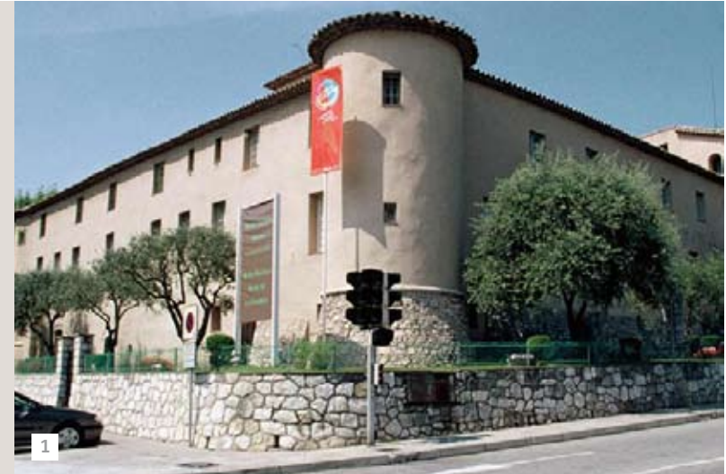
(1) Musée Picasso à Vallauris

Aujourd'hui, c'est à vous que revient ce privilège. Décider de vivre au cœur d'une ville et d'un tissu économique unique, Sophia Antipolis, tout en profitant de l'art de vivre si recherché de la Côte d'Azur. Bienvenue dans votre résidence, le Clos de Léouse. Un écrin vert bâti dans les règles les plus strictes du développement durable pour les générations futures.