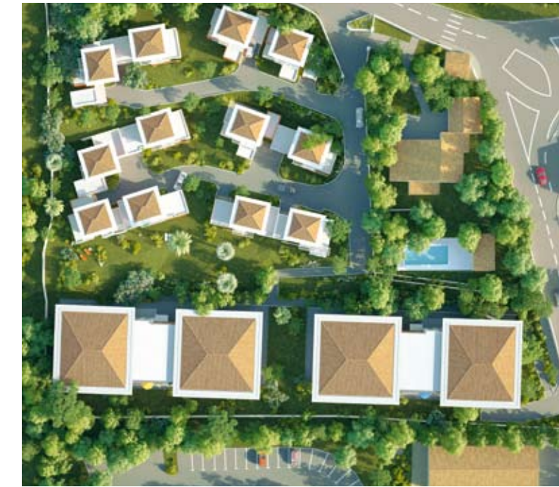
Les couleurs des matières employées rappellent l'argile et les poteries de Vallauris.