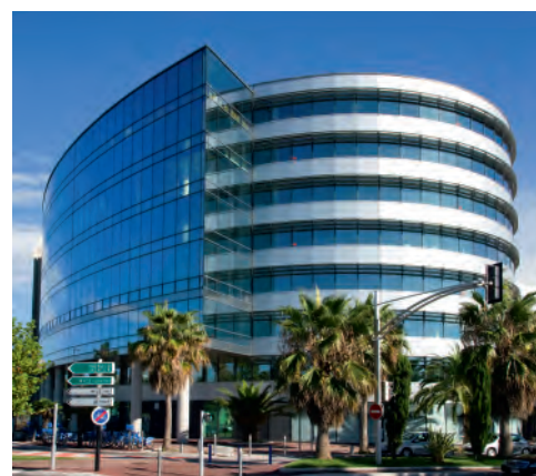
Le centre d'affaires de l'Arénas, symbole du dynamisme économique

Au centre de Saint-Laurent-du-Var, la résidence Novea est sans conteste une adresse stratégique au cœur du développement de la Côte d'Azur.