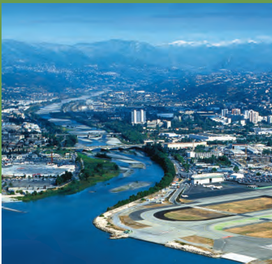
L'Eco-Vallée de la Côte d'Azur : première Opération d'Intérêt National dédiée au développement durable

Terre d'accueil et de culture, la Côte d'Azur est le symbole du bien-vivre et demeure, depuis des décennies, une valeur de choix pour vivre ou séjourner.