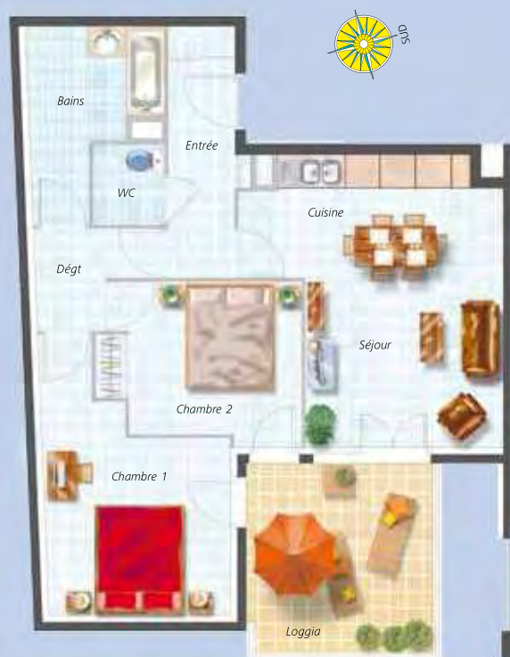
Exemple d'appartement 3 pièces (n° A406) surface habitable: 59 m 2 , loggia: 11 m 2 , vendu non meublé, dans la limite des stocks disponibles.