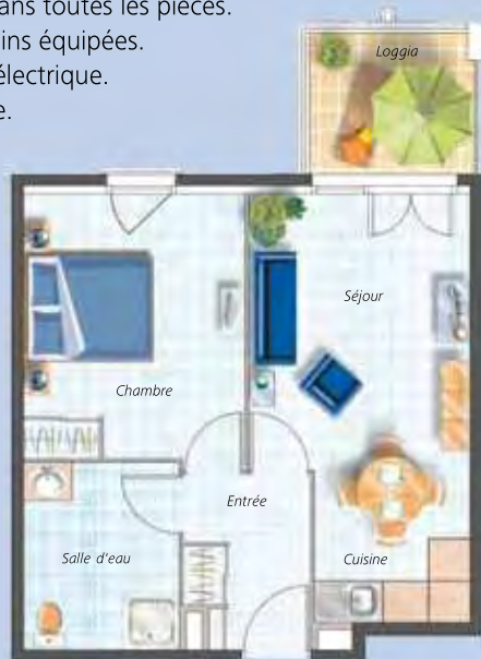
Exemple d'appartement 2 pièces (n° A304) surface habitable: 40 m 2 , loggia: 4,80 m 2 , vendu non meublé, dans la limite des stocks disponibles.