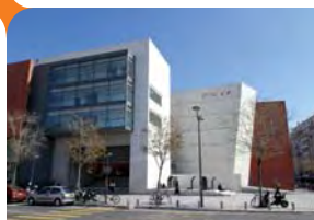
Fac de Saint-Angely