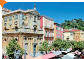
Cours Saleya - Vieux Nice

Located in the area of future strategic challenges, the NICE CITY Residence fits well into dynamic economy. It offers all the best guarantees to meet the demands of investors, anxious to build up a solid capital and to benefit from all the advantages of purchasing new real estate with a tax deduction.