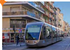
Tramway à Nice