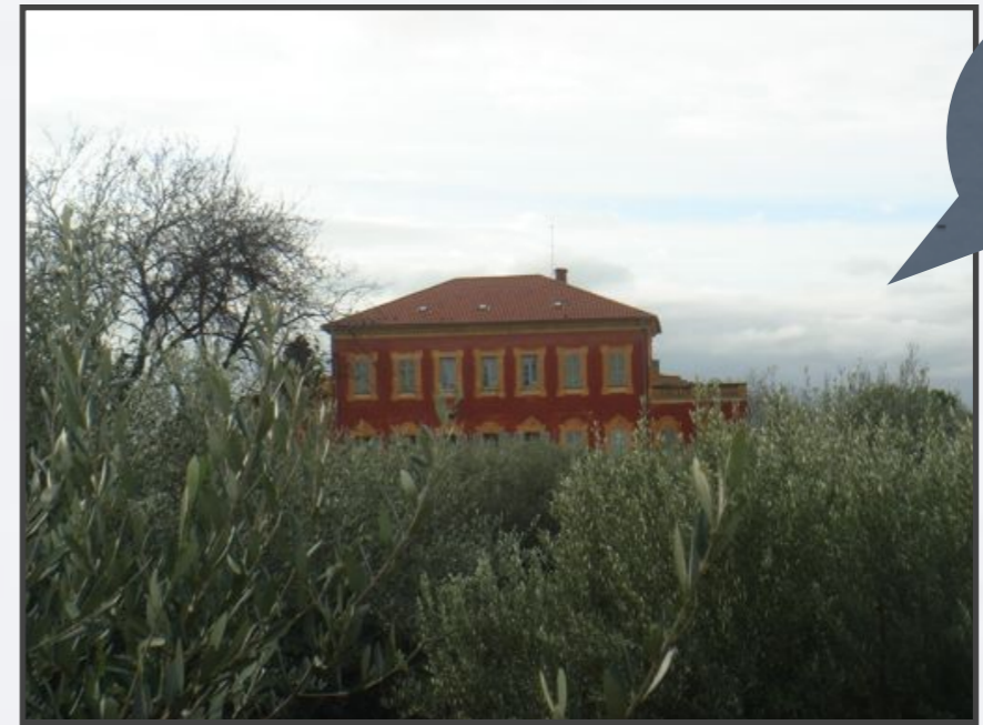
Le Musée MATISSE