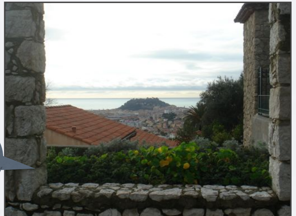
La vue du monastère