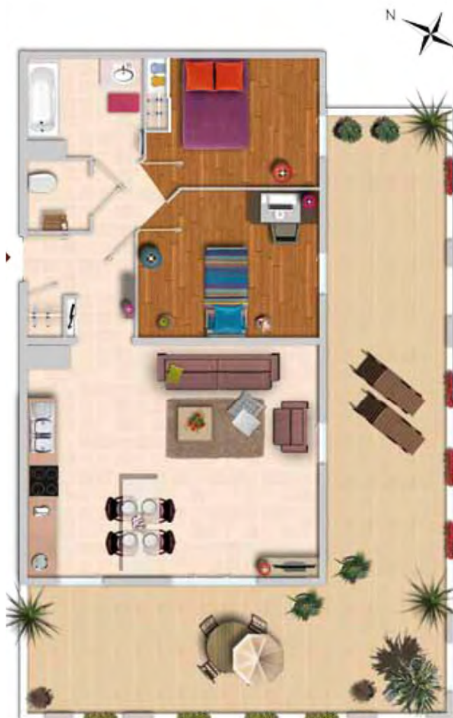
Exemple d'appartement 3 pièces (Lot A103 - 62,80 m 2 + Balcon 46,30 m 2 ) (1)

* Cet immeuble fera l'objet d'une demande de label BBC- effinergie ®, Bâtiment Basse Consommation, auprès de l'organisme certificateur Cerqual.