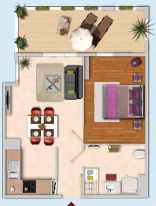
Exemple d'appartement 2 pièces (Lot A201 - 40,75 m 2 + Balcon 12,30 m 2 ) (1)

Habiter un Bâtiment Basse Consommation (BBC- effinergie ®) conçu par Bouygues Immobilier, c'est l'assurance d'un confort optimisé, à travers un logement économe en énergie et respectueux de l'environnement. Pour obtenir de telles performances, toute la conception a été réinventée afin d'atteindre l'ultra performance du bâtiment et d'en limiter ses besoins en ressources.